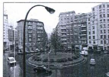
Plaza Amézola, donde el Batallón Vasco Español asesinó a tres personas en 1980.

ción determinó que el hecho de que en el centro se impartieran clases de euskara durante el verano pudo alimentar las iras de los autores. La joven fallecida se encontraba en avanzado estado de gestación.