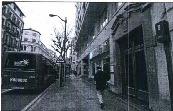
Portal de la calle Alameda Recalde en el que tenía su consulta Santiago Brouard y donde fue asesinado por los GAL en 1984.

to, entre los que se encontraban el Rey, el presidente Aznar, o el lehendakari Ardanza. Recibió varios disparos a quemarropa de uno de los terroristas, que emprendió una huida a la carrera escapando sin ser detenido.