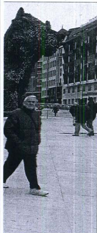
Explanada del Guggenheim, donde fue asesinado el ertzain Txema Agirre en 2007.