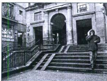
Escaleras de acceso a la Plaza Nueva, donde cayó asesinado Tomás Sulibarria en 1980.

ETA no perdona a sus traidores y él portaba esa etiqueta. Tras haber militado en la banda años atrás, había decidido abandonarla por su