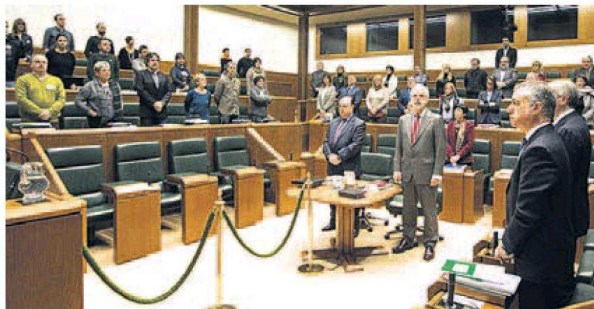
Minuto de silencio por Casas y Buesa en el Parlamento.

presentación política en el vitoriano museo Artium, entre los que destacaban Alfonso Alonso, ministro de Sanidad en funciones; la presidenta del Parlamento vasco, Bakartxo Tejería,